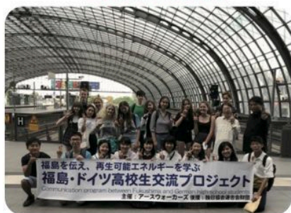
ベルリン中央駅にて