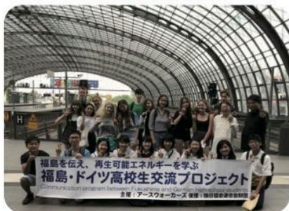
ベルリン中央駅にて